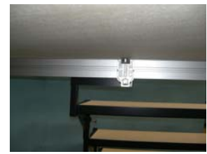
Befestigung an der Bühne (fixation to the stage)

Treppe 3- oder 4-tlg. Bestehend aus einzelnen Stekelementen, die aufeinander aufbauen. Stahlkonstruktion mit Multiplex Trittstufen 3-tlg. Treppe für Bühnenhöhen von 40, 60, 80 cm 4-tlg. Treppe für Bühnenhöhen von 40, 60, 80 und 100 cm (alternativ Steigung 162/3 cm möglich)