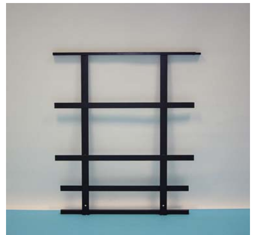
mit Stuhlhalteleiste With chair safety ledge

Schutzgeländer für Bühnenpodest FIX und Schere, incl. Befestigungsmaterial und Zwischenstück. Durch die zusätzliche Querstrebe (Unterzug) besonders stabile Ausführung, da sich die Kräfte hauptsächlich auf die Steckbeine und nicht auf den Oberrahmen verteilen.