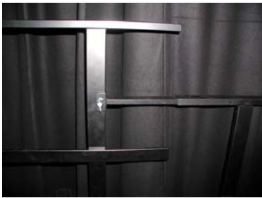
Zwischenstück für Stufenaufbau (Chor, Tribüne)

Intermediate part for chorus and grandstand