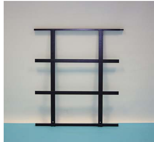
Schutzgeländer für Trenomat FIX/Schere Security rails für Trenomat FIX/Scissor